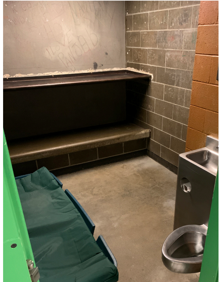
Cárcel principal, celda diseñada para una persona ahora tiene espacio para tres.

Nuestra meta es proporcionar instalaciones, personal, recursos y servicios adecuados en todo momento a todas las personas que interactúan con el sistema jurídico penal.