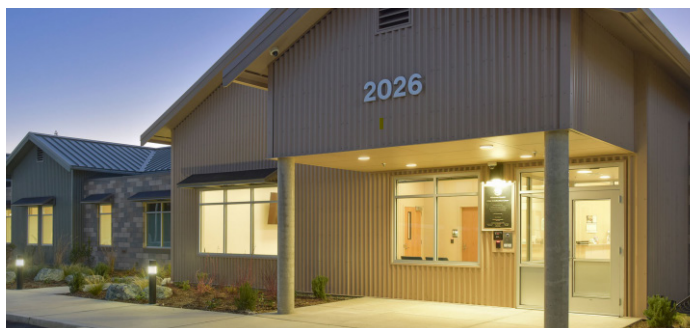
Centro de estabilización de crisis actual / Anne Deacon Center for Hope en el condado de Whatcom.

Servicios para ayudar a las personas que salen del sistema penitenciario a encontrar trabajo y vivienda, y reducir la posibilidad de reincidir.